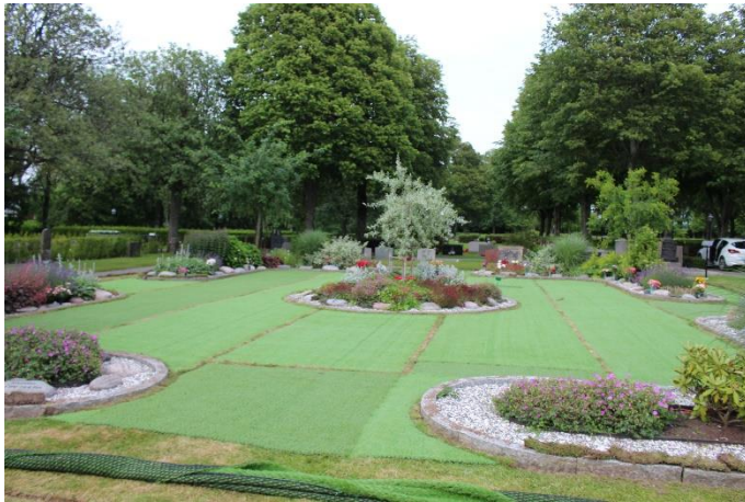
Minneslund Värö Kyrka