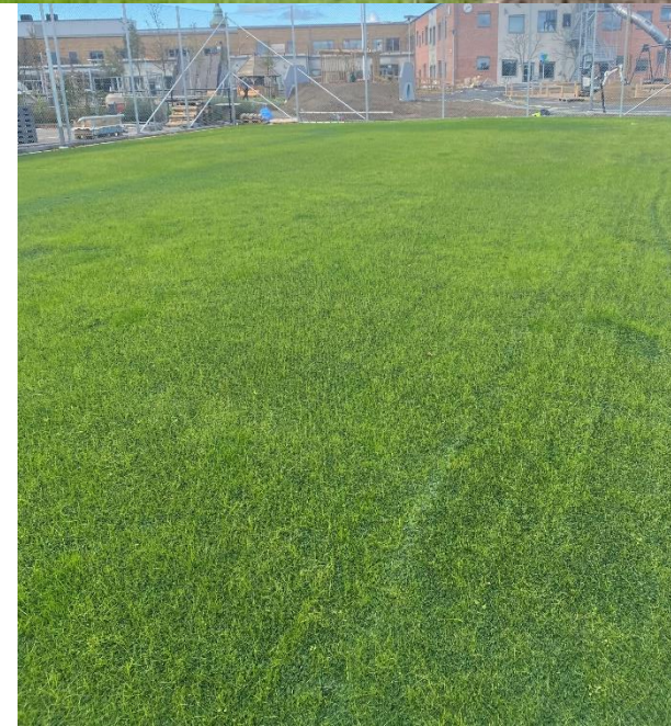
Nedan skolfotboll Ystad