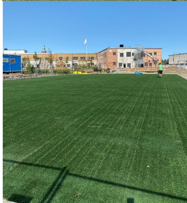
Ovan Park Svedala